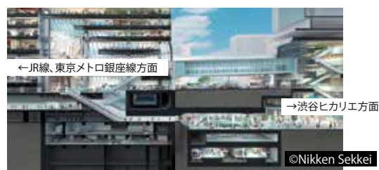
渋谷スクランブルスクエア アーバン・コア断面図 渋谷の回遊性向上の起点として機能します。

※アーバンコア媒体各種について、同時申込の場合はUCビジョン+オプションやジャックにてお申込みの広告主を優先します。