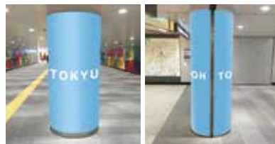
道玄坂アドサークルB