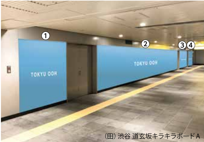
(田) 渋谷 道玄坂キラキラボードA

●田園都市線渋谷駅B1F、道玄坂方面へ向かう広大な壁面を贅沢にジャックできます!