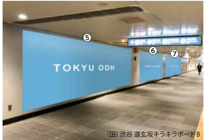
(田) 渋谷 道玄坂キラキラボードB

掲出期間：7日間・掲出料 *2025年度【S期:12・3月】【A期:4・6・7・11月】【B期:5・8・9・10月】【C期:1・2月】