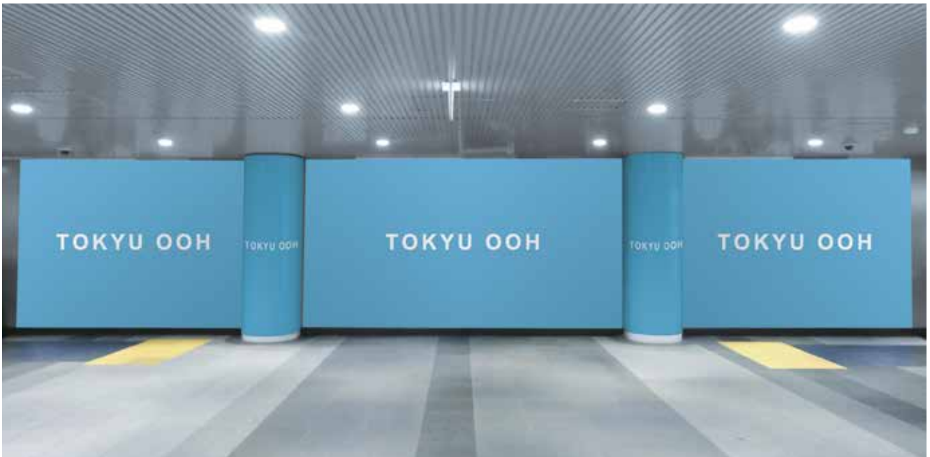
※柱オプション掲出モニター

●田園都市線渋谷駅ハチ公改札内に設置され、注目率が抜群な3面構成の多目的ボードです。