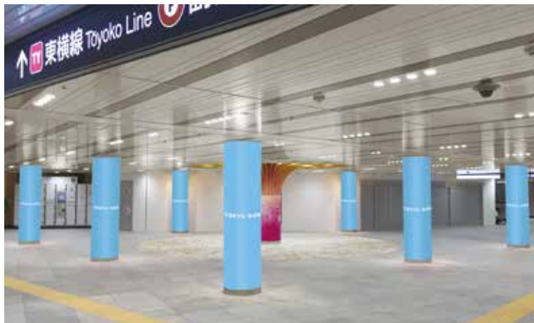
道玄坂アドサークルA