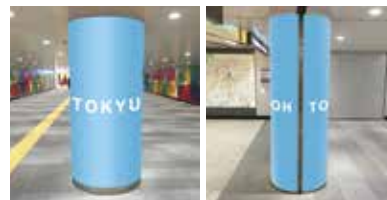
道玄坂アドサークルB