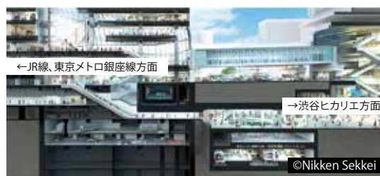
渋谷スクランブルスクエア アーバン・コア断面図 渋谷の回遊性向上の起点として機能します。