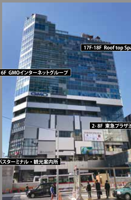
17F-18F Roof top Space

渋谷フクラス1F観光案内所「shibuya-san」企画展示スペースやBarの機能もあり、渋谷インバウンド重要拠点の役割が期待されます。