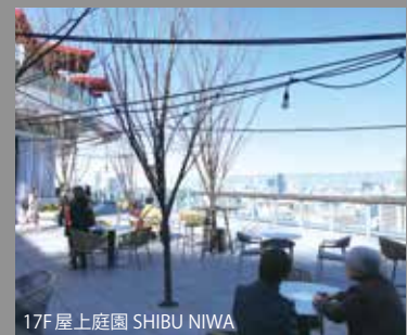
17F 屋上庭園 SHIBU NIWA