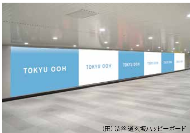
(田) 渋谷 道玄坂ハッピーボード

●田園都市線渋谷駅と、東横線横浜駅に設置されたインパクト+付加価値を与えることができるボードです。