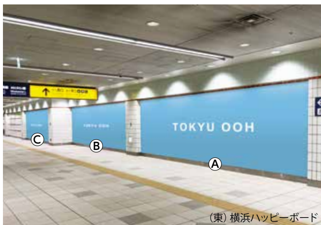
(東) 横浜ハッピーボード

掲出期間：7日間・掲出料 *2023年度【S期:12-3月】【A期:4-6-7-11月】【B期:5-8-9-10月】【C期:1-2月】