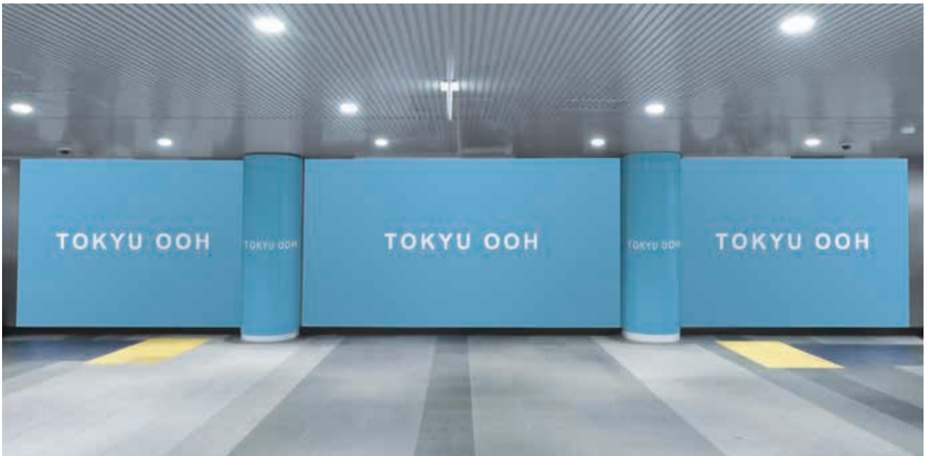
※柱オプション掲出モニター

●田園都市線渋谷駅ハチ公改札内に設置され、注目率が抜群な3面構成の多目的ボードです。