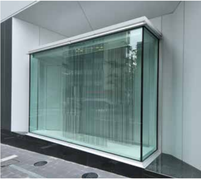
渋谷ヒカリエ・ショーウィンドウ①

● 青山通りに抜ける渋谷ヒカリエの外壁に自由なレイアウトで訴求できるディスプレイスペースを設けました。