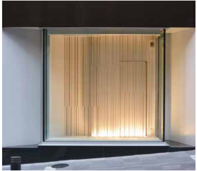
渋谷ヒカリエ・ショーウィンドウ②