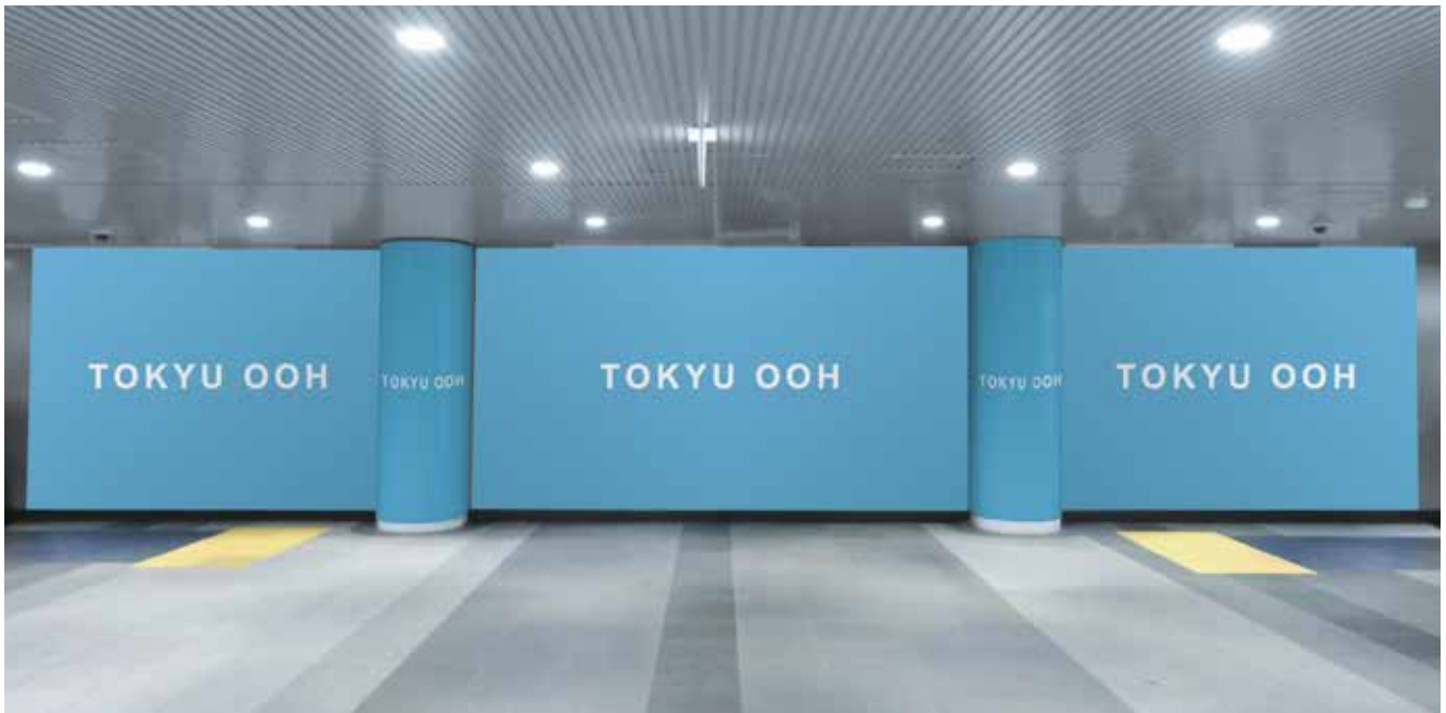
※柱オプション掲出モニター

●田園都市線渋谷駅ハチ公改札内に設置され、注目率が抜群な3面構成の多目的ボードです。