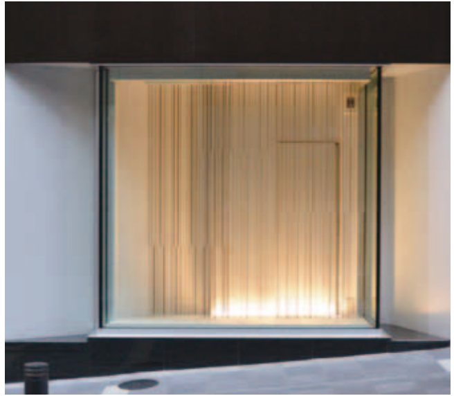
渋谷ヒカリエ・ショーウィンドウ②