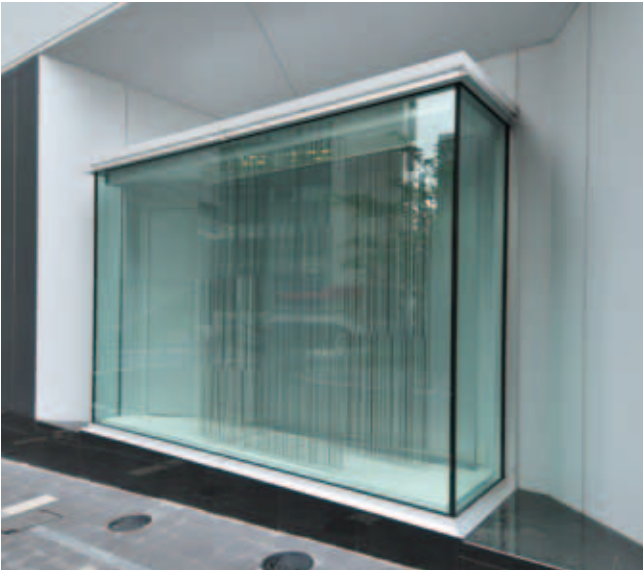
渋谷ヒカリエ・ショーウィンドウ①

● 青山通りに抜けるヒカリエの外壁に自由なレイアウトで訴求できるディスプレイスペースを設けました。