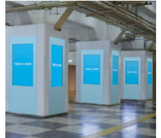
東急百貨店・東横店2F TOQサイネージピラー 扉面ラッピング