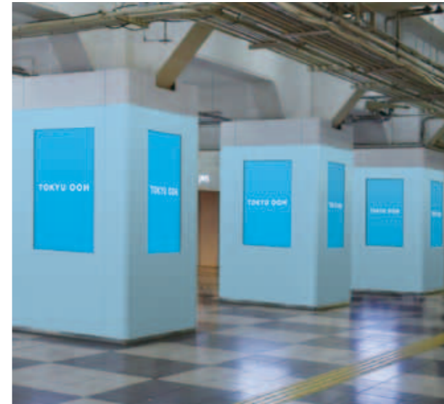
東急百貨店・東横店2F TOQサイネージピラー フルラッピング

●ディスプレイ周りにシートを貼り、ジャック感・インパクトを引き上げるオプションメニューです。